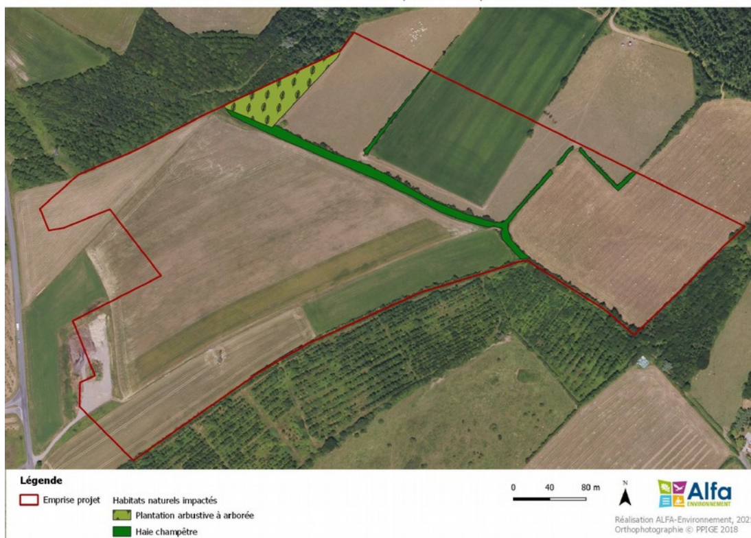
Carte 10 : Détail des haies et plantations impactées